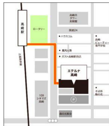
▲会場地図